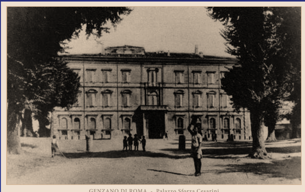
GENZANO DI ROMA - Palazzo Sforza Cesarini

Giro Turistico "Castelli Romani" con visita al Palazzo Sforza Cesarini Genzano di Roma